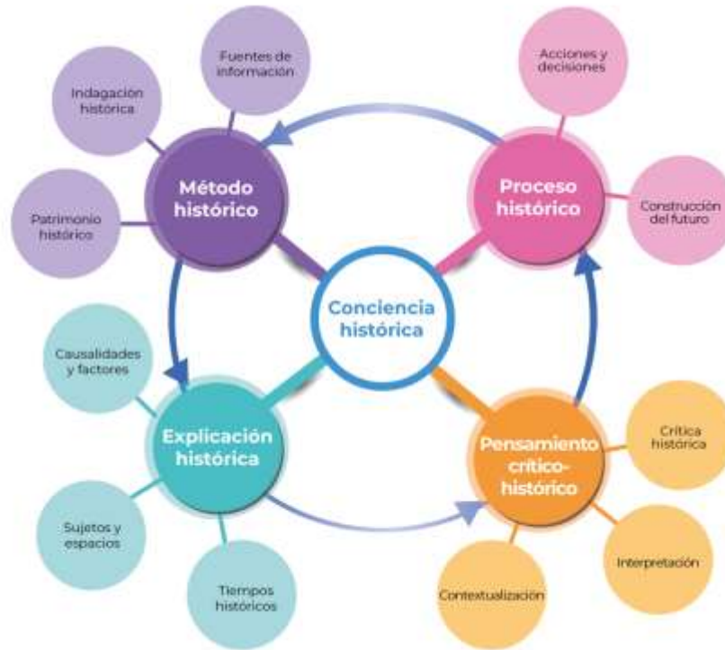
Diagrama de categorías y subcategorías