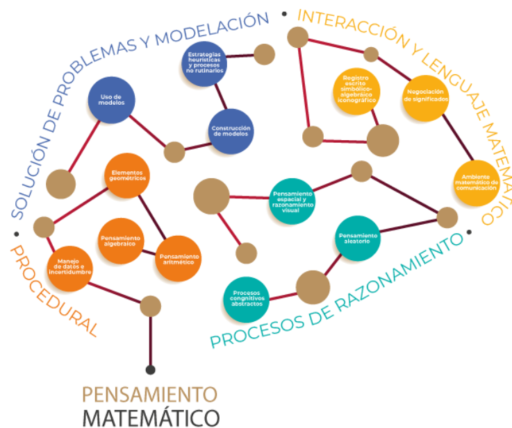
Figura 1. Pensamiento Matemático. Categorías y Subcategorías.

En la enseñanza tradicional de la matemática se identifica predominantemente la presencia de la categoría procedural, por lo que una parte fundamental de la propuesta consiste en, sin perder el cuidado de los avances realizados en esta categoría, buscar favorecer el desarrollo de las otras tres.