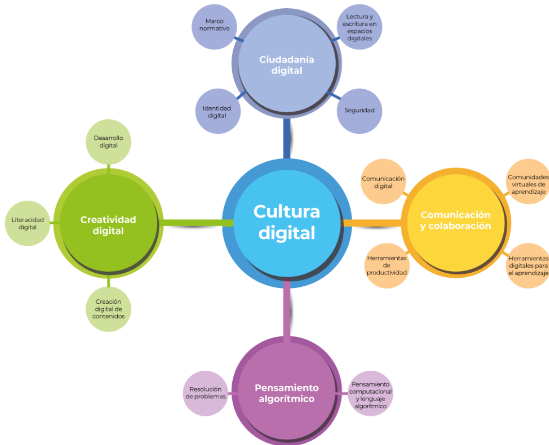
Figura 1. Categorías y subcategorías de Cultura digital